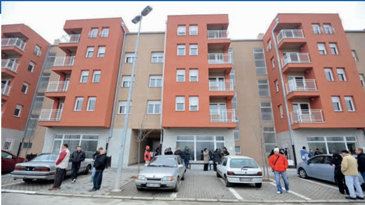
HILJADU NEPROFITNIH STANOVA: Useljeno ukupno 270, a do kraja godine još 730

mu i žensku ribicu-borca kao društvo, ali je on toliko napada da sam morala da je izolujem, plašim se da ne nastrada”, objašnjava i vraća se na početak. “Za konkurs sam saznala preko novina, pitali su me prijatelji: ‘Pa što ne konkurišeš, ti toliko uslova ispunjavaš?’ Izvadila sam sve papire, potvrdi i račune iz prethodnih stanova gde smo bili podstanari. A onda, nekoliko meseci posle toga, jedan pacijent mi je doneo novine u kojima su objavljene rezultati konkursa, i podvukao je moje ime. Ujutru, kad sam došla na posao, svi su mi čestitali, a ja još nisam ni znala da sam prošla na konkursu”, priseća se N. R. “Bilo nam je ponuđeno nekoliko stanova, odabrali smo ovaj i posle dugo razmišljali da li je možda bilo neke bolje solucije, ali, mislim da se uvek dešava ono što treba da se desi, i ovaj stan je verovatno bio namenjen nama”, kaže doktorica uz širok osmeh.